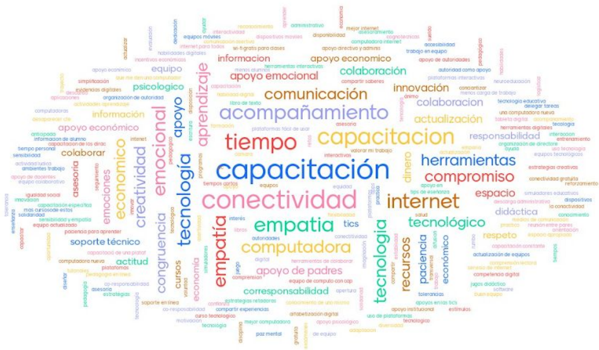
Imagen 2. Nube de palabras que describen los tipos de apoyo que requieren en esta nueva realidad

De acuerdo a la conversación con los docentes, los tipos de apoyo que mencionaron que se requieren para poder enseñar a distancia se pueden agrupar en los siguientes: